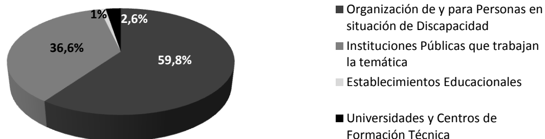
Gráfico N°2. Organizaciones Participantes. Diálogo Ciudadano para el Diseño e Implementación del ENDISC II en la XV Región (194 personas)